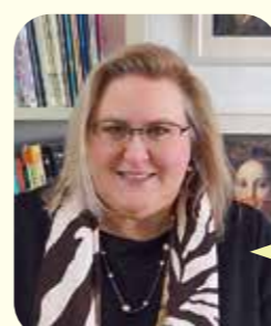
カタリーナ モーク 英語指導法演習 CLIL「内容言語統合型学習」を中心に

内容言語統合型学習とは、学習者の母国語ではない言語を使って教科を教える方法論です。この「ゼミ」では、言語学、言語教育の理論と実践、リベラルアーツの他の教科の内容をミックスして、すべて英語を通して学びます。