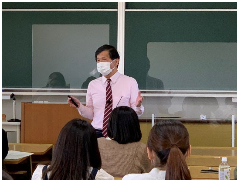
<オリエンテーションの様子>

本年度の教員採用選考試験の合格発表も終わり、次年度受験する学生の皆さんを対象に、10月18日(火)、「教職特別講座」のオリエンテーションを行いました。現在、3年生を中心とした「教職特別講座」が始まっています。これから、約1年にわたり様々な演習を重ねていきます。